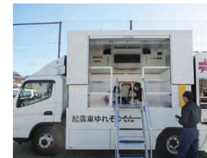
起震車で地震体験