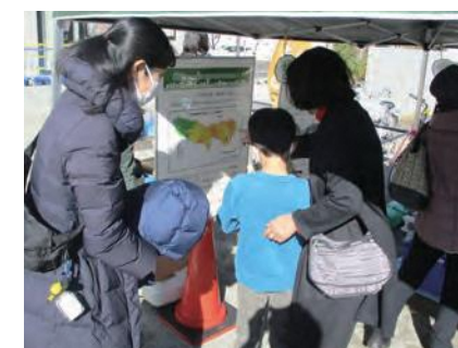
防災クイズコーナー