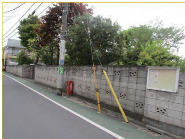
ブロック塀の撤去

人的・物的被害や道路閉そくを防止するため、倒壊の恐れがあるブロック塀等の撤去費用を助成します。