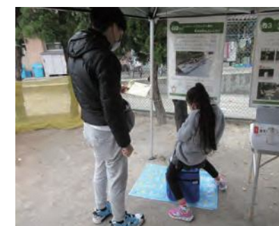
防災クイズコーナー