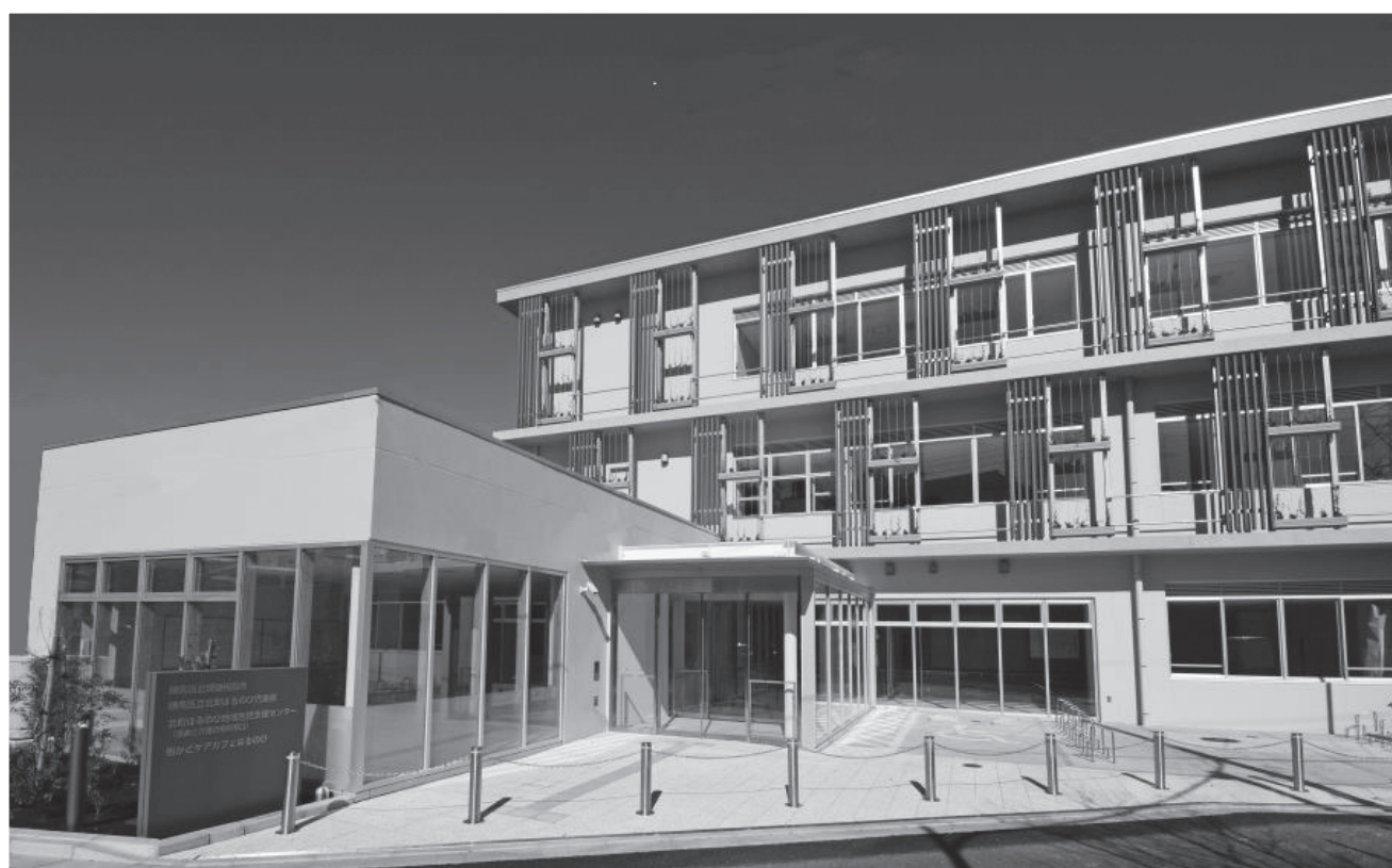
北町に完成した、保健相談所・地域包括支援センター・街かどケアカフェ・児童館が一体となった複合施設