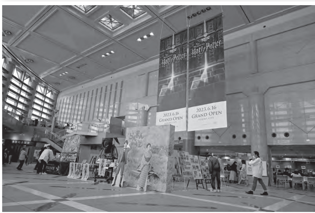
Warner Bros. Studio Tour Tokyo - The Making of Harry Potter.

区役所アトリウムでのNHK連続テレビ小説「らんまん」紹介パネル展や スタジオツアー東京の開設に合わせた庁内装飾の様子