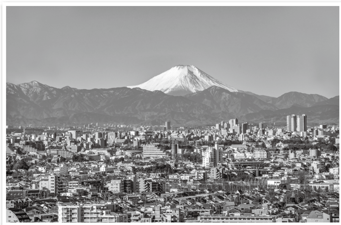
区役所20階展望ロビーからの富士山