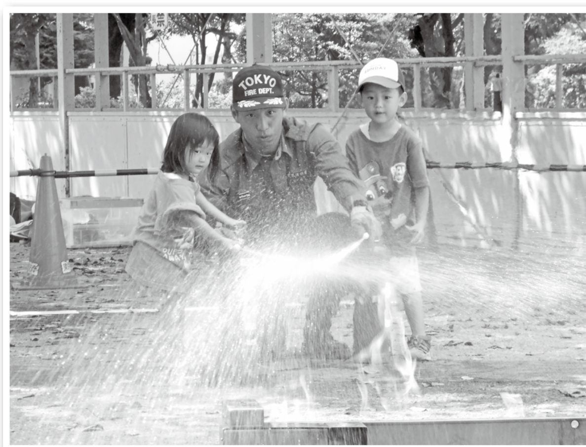
子どもたちが防災フェスタで初期消火体験