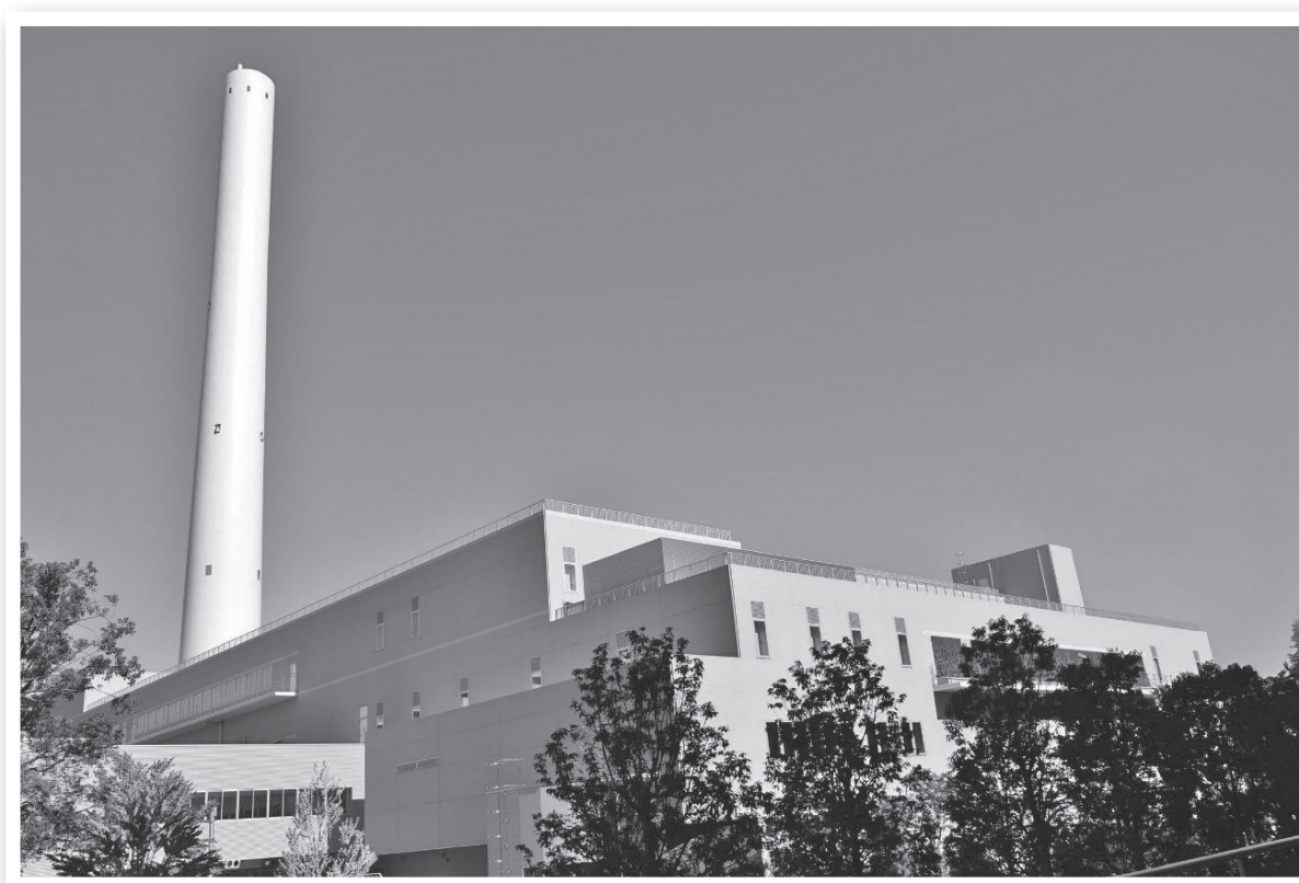
リニューアルした光が丘清掃工場