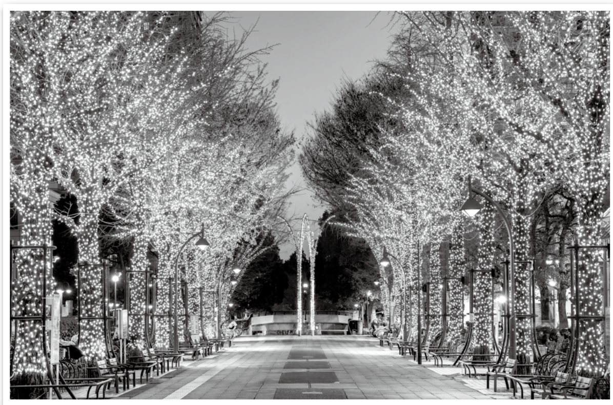
ふれあいの径イルミネーション（光が丘）