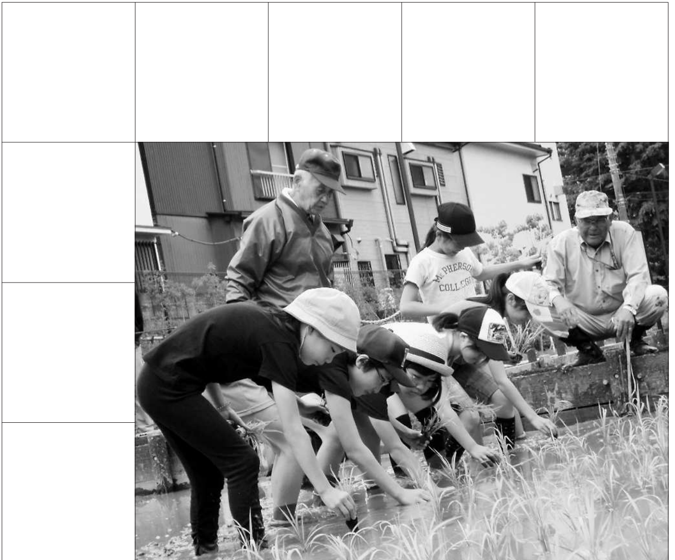
大泉橋戸公園内に新設された水田で田植え体験