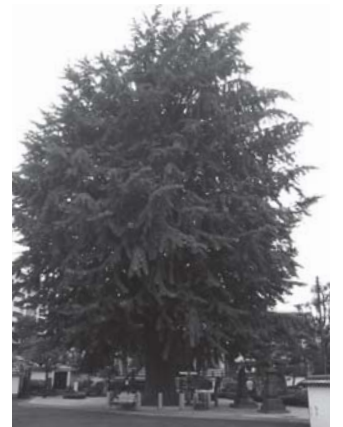
金乗院の大イチョウ 金乗院 写真②