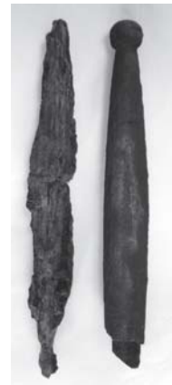
丸山東遺跡出土の石棒 練馬区 写真①