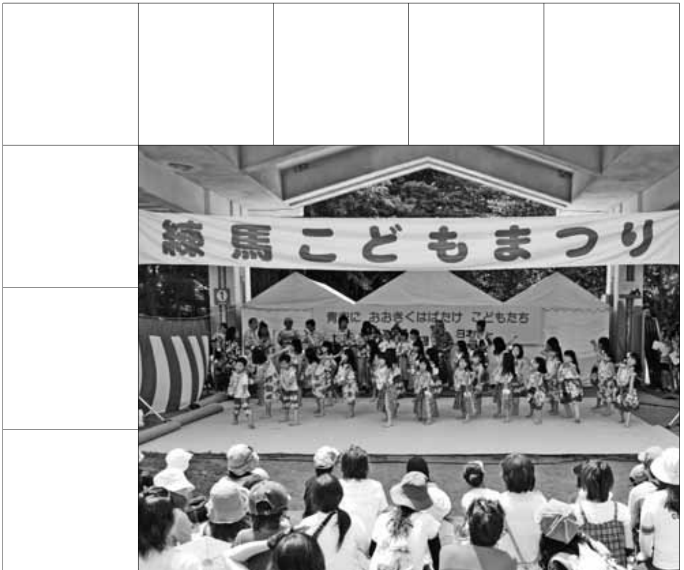
練馬こどもまつり