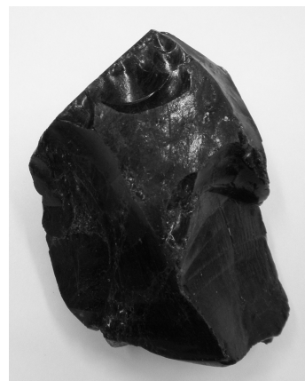
天祖神社東遺跡出土の石核 練馬区 写真②