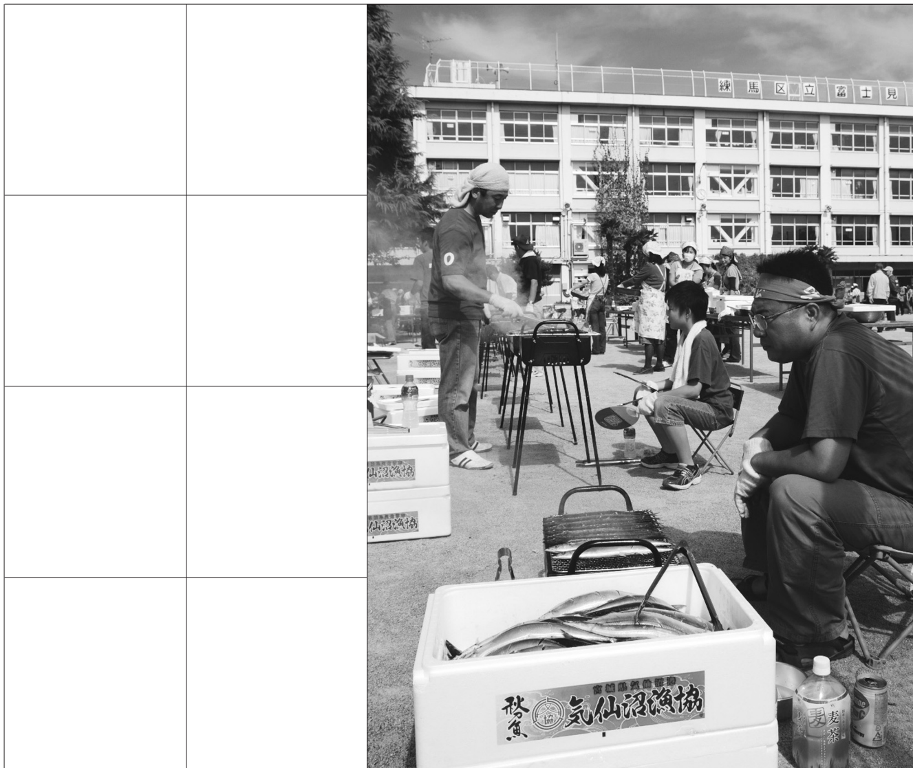
サンマで全校親睦会（区立富士見台小学校）