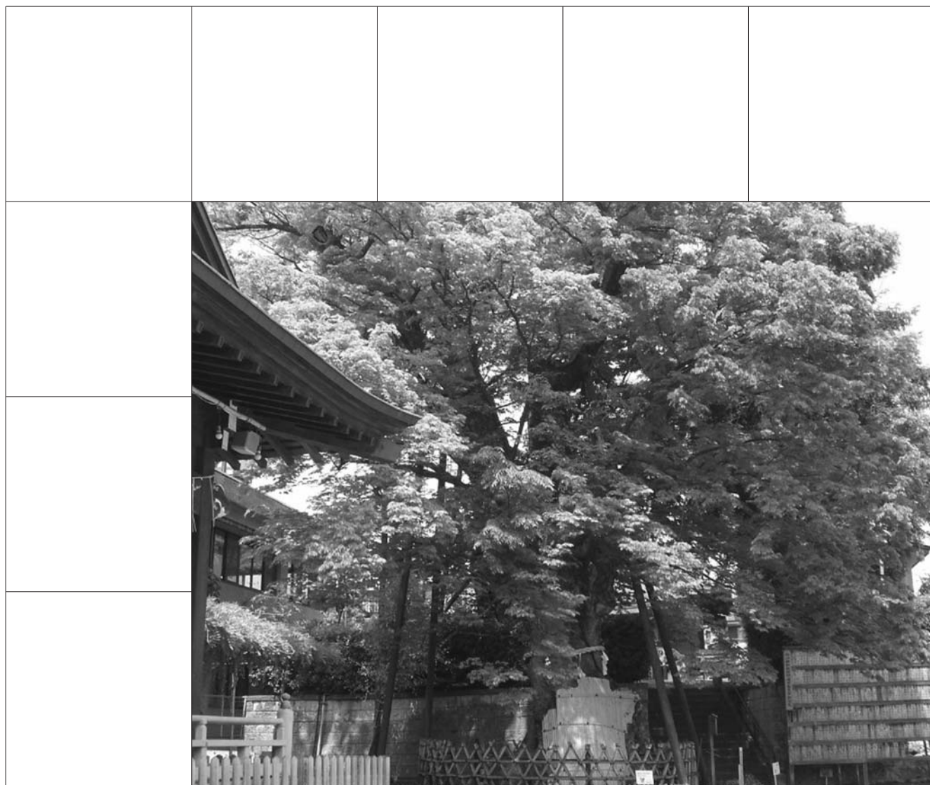
白山神社の大ケヤキ