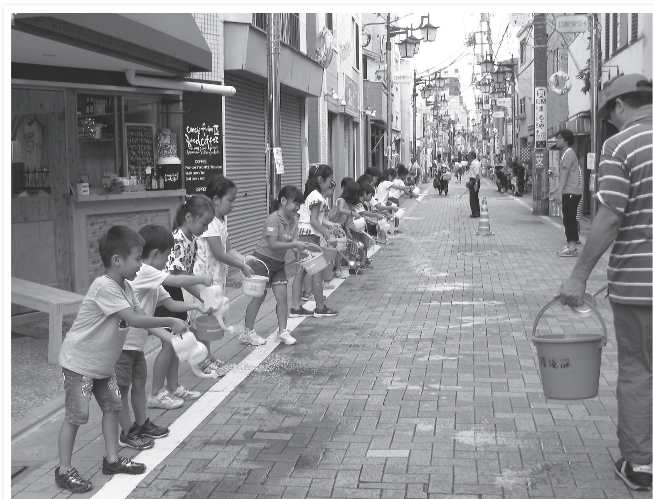
商店街での打ち水大作戦