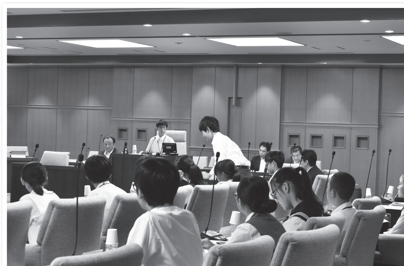
政策提言案を議論する子ども議員（練馬子ども議会）