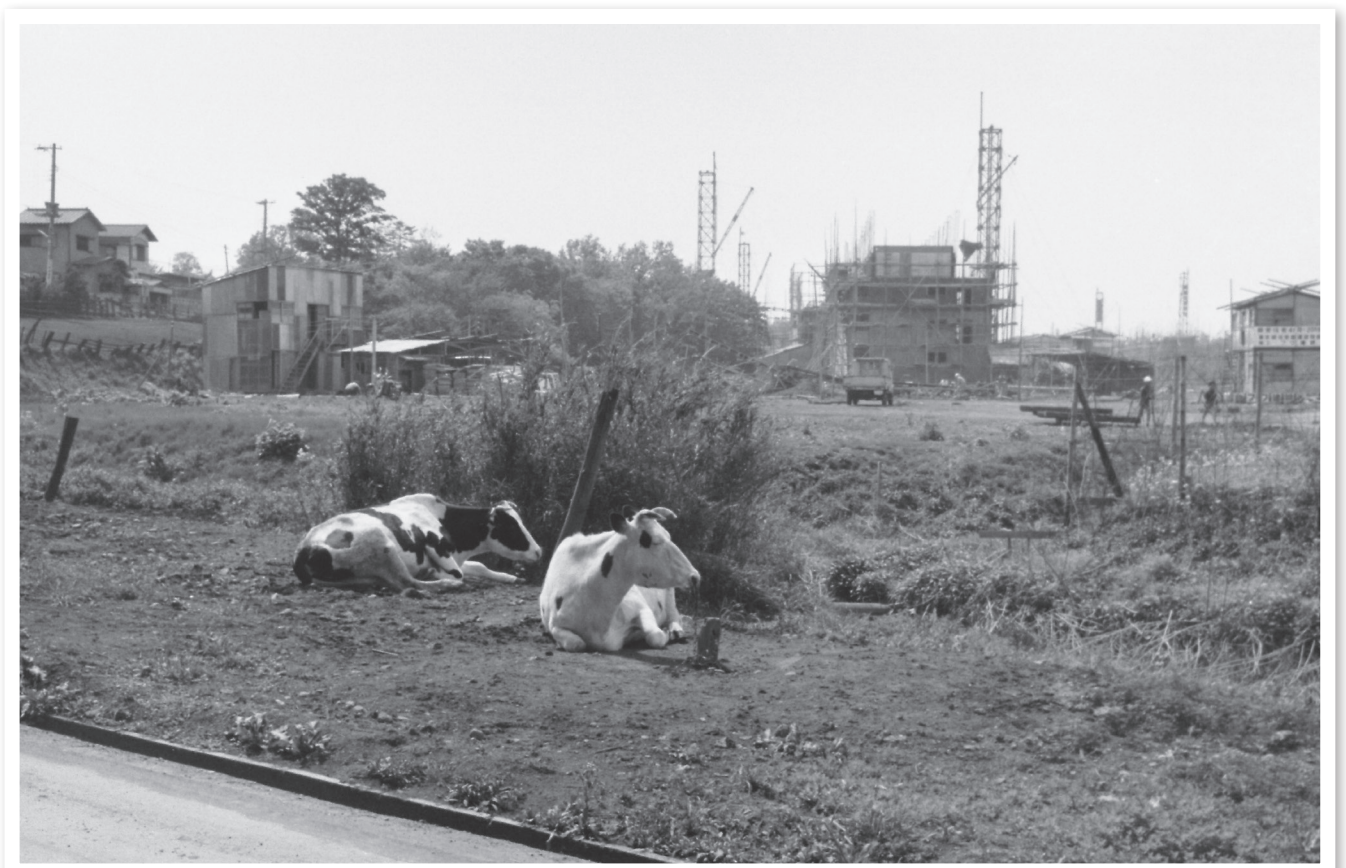
寄贈された写真から「南田中にあった積田牧場周辺（昭和 40 年代）」