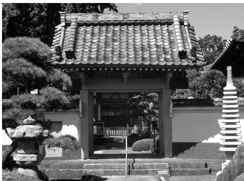
〔30年度に新規登録された金乗院山門〕