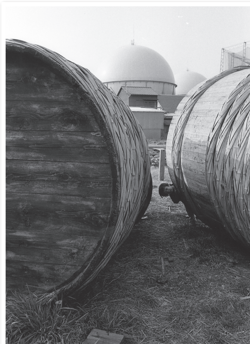
寄贈写真より「漬物樽のある風景（昭和50年代）」