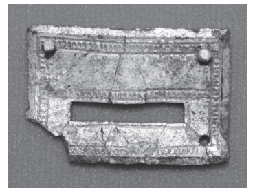
金銅製飾具 練馬区 写真①