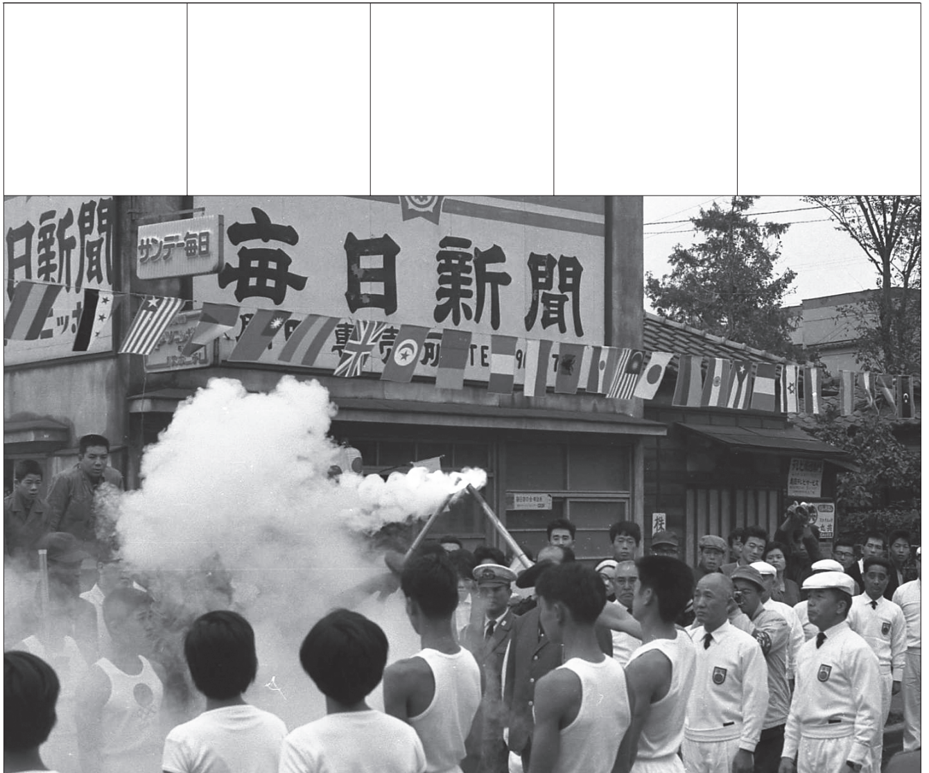
東京オリンピック聖火リレー 関町付近（昭和39年）