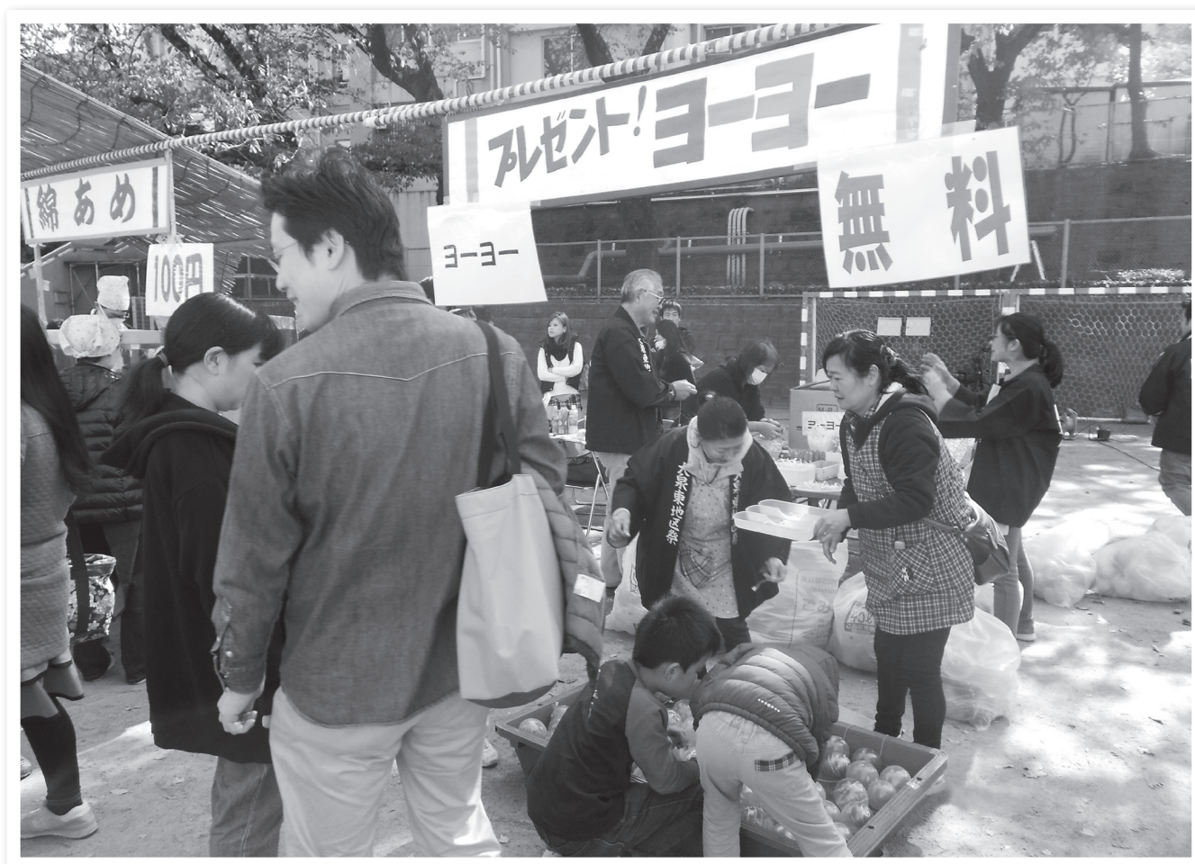
青少年育成地区委員会、町会・自治会などが主体となり、区内の17地区ごとに開催されている地区祭（写真は大泉東地区祭）