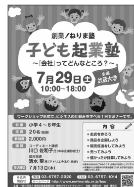
[子ども起業塾 ポスター]

創業するための基礎的知識やノウハウを学ぶセミナー「創業！ねりま塾」を実施している。29年度に開催した5コースは、入門編141人、実践編54人、女性編74人、地域創業編19人、子ども編30人が受講した。