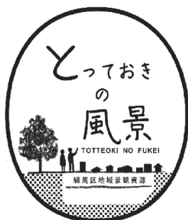
〔「とっておきの風景」登録プレート〕

ルールを決めて良好な景観づくりに取り組む「景観まちなみ協定制」は、区内5つの地域を認定している。