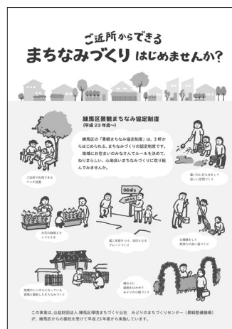
〔景観まちなみ協定制 パンフレット〕