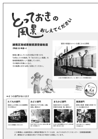
〔地域景観資源登録制度 パンフレット〕

ルールを決めて良好な景観づくりに取り組む「景観まちなみ協定制」は、区内5つの地域を認定している。