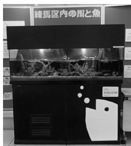
【アトリウム展示水槽】

ヤなどの魚類や水生植物が確認された。一方、特定外来生物の生息も確認されており、今後とも状況を見ていく必要がある。