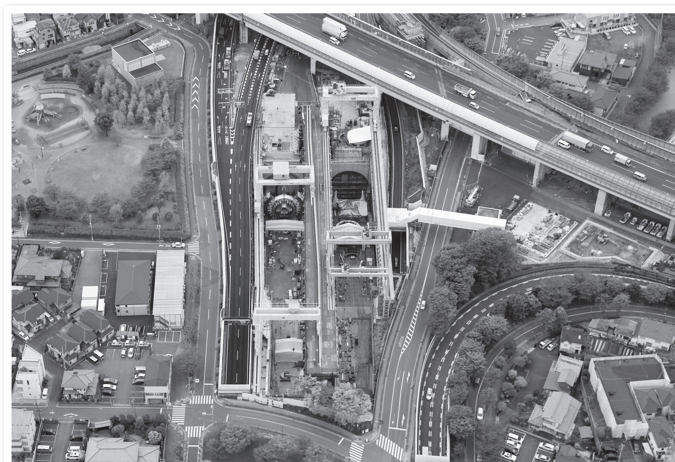
東京外かく環状道路の工事の様子