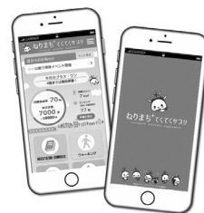
〔ねりまちてくてくサブリ画面イメージ〕

29年11月から健康管理アプリ「ねりまちてくてくサブリアプリ」の運用を開始した。