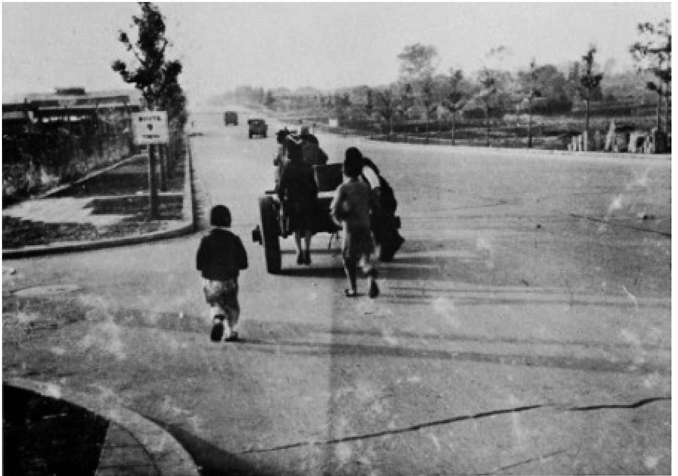
馬車がのんびり通る川越街道（昭和 22 年撮影）