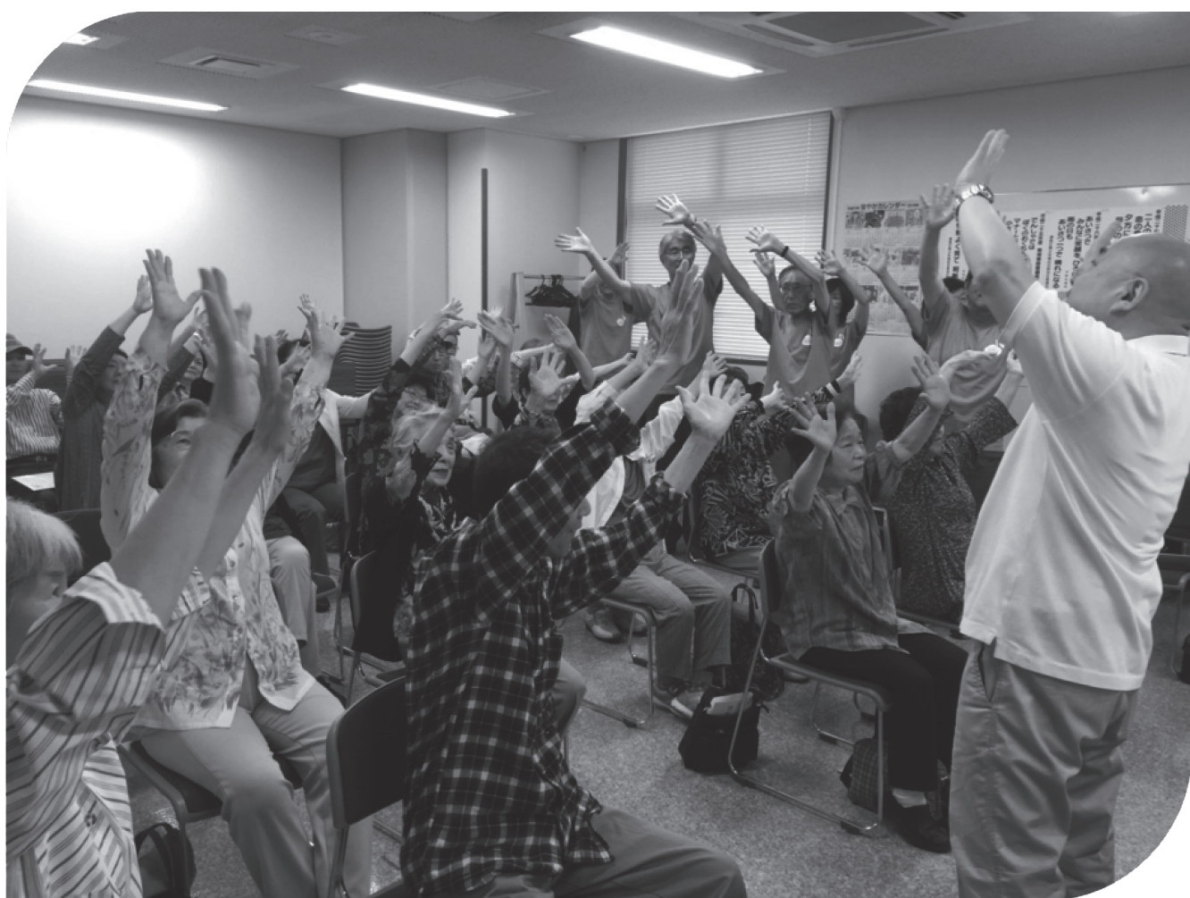
街かどケアカフェ こぶしで行っている歌声カフェ 歌いながら体操をする参加者