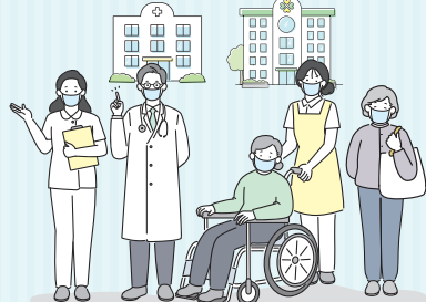
医療機関・高齢者施設などへの訪問