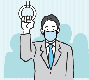
通勤ラッシュ時などの電車・バス