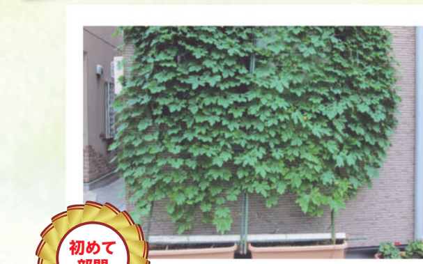
永森さん 車の日よけになりました。