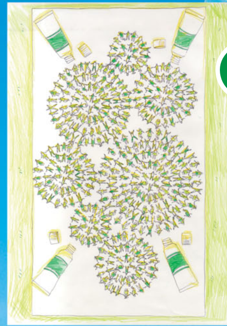
人文字アート(イメージ)

日時 9月5日(土)午前9時～正午(雨天6日(B)) 場所 石神井松の風文化公園(石神井台1-33-44) ※地図は特集号3面を参照。