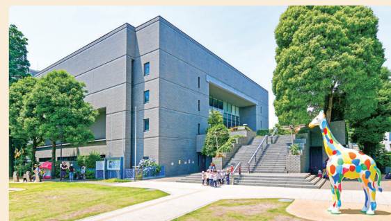
現在の建物を有効に活用することを基本とします