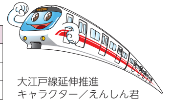
大江戸線延伸推進キャラクター／えんしん君