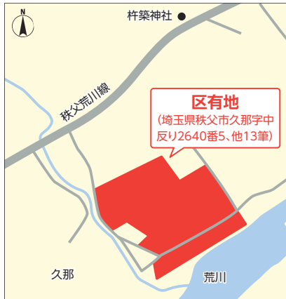
▶ 交通 ：秩父鉄道浦山口駅から徒歩30分

▶ 面積 ：7,891.85㎡▶ 最低売却価格 ：200万円▶ 用途地域など ：非線引き都市計画区域(用途指定なし)、河川区域