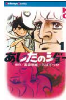
「あしたのジョー」©高森朝雄・ちばてつや/講談社

昭和14年生まれ。43年に連載が開始された「あしたのジョー」(原作:高森朝雄)は、時代を象徴する、一大社会現象となる。平成14年に紫綬褒章、24年に旭日小綬章を受章。26年に文化功労者、29年に練馬区名誉区民に選定。令和6年に文化勲章を受章。