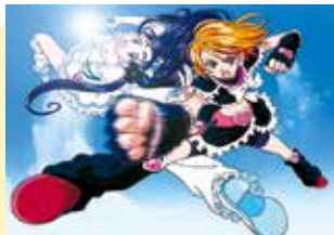
「ふたりはプリキュア」©東映アニメーション