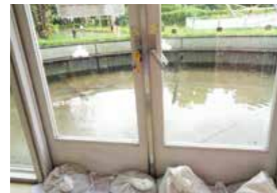
▲施設の冠水 令和7年9月(目黒区)