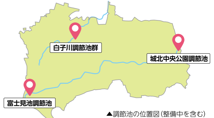
▲調節池の位置図(整備を含む)