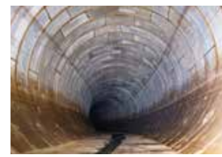
▲白子川地下調節池

集中豪雨などによる洪水を防ぐため、区内には調節池が整備されています。調節池は、雨が多きときに川の水位を一時的にためて調節し、川の水位を下げます。区内には白子川調節池群、富士見池調節池があるほか、城北中央公園調節池などの整備も進められています。