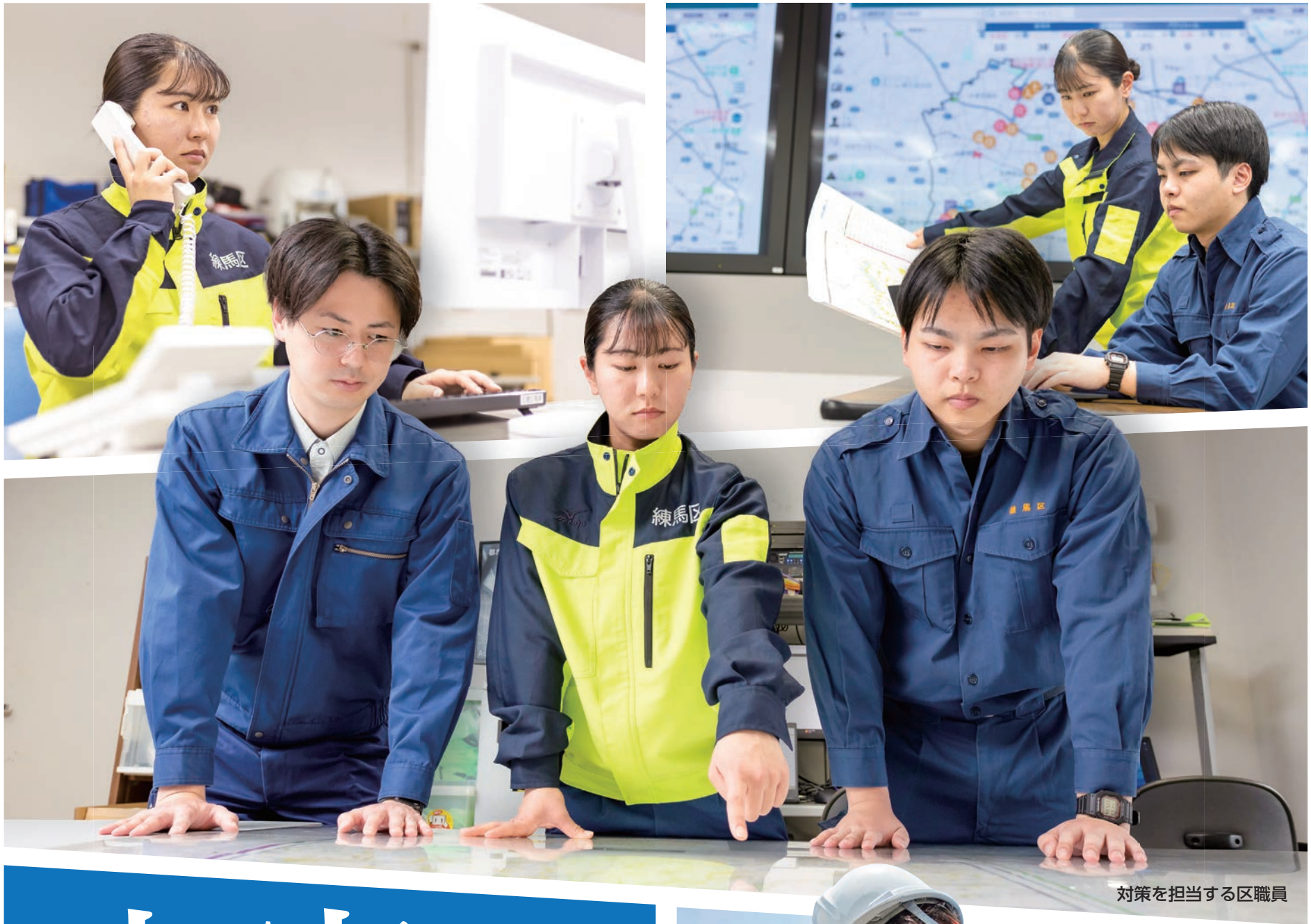
対策を担当する区職員