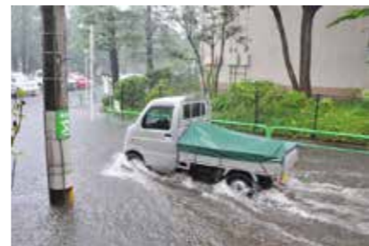
▲道路の冠水 平成22年7月(練馬区)