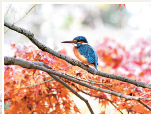
石神井公園のカワセミ (石神井台1・2丁目、 石神井町5丁目)