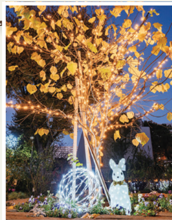
四季の香ローズガーデン (光が丘5-2-6)