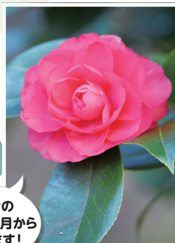
早咲きの ツバキは2月から 楽しめます！