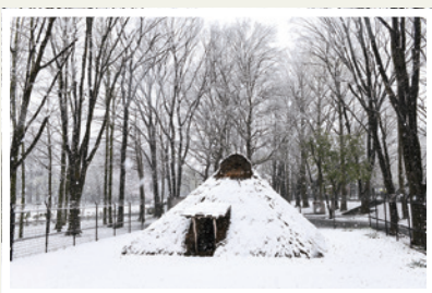
城北中央公園 (氷川台1丁目、羽沢3丁目)