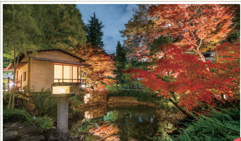
向山庭園(向山3-1-21) ※ライトアップは11月下旬～12月上旬の 日没～午後8時30分に実施予定(雨天中止)。 詳しくは、同園HPをご覧ください。