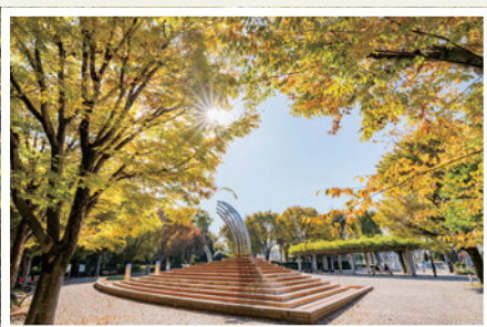
大泉中央公園(大泉学園町9丁目)