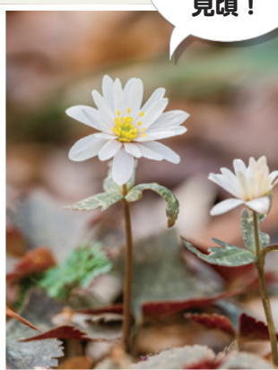
2月上旬～ 3月下旬が 見頃！ 牧野記念庭園の ユキフリイチゲ (東大泉6-34-4)