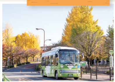
練馬総合運動場公園前 (練馬2-29-10)