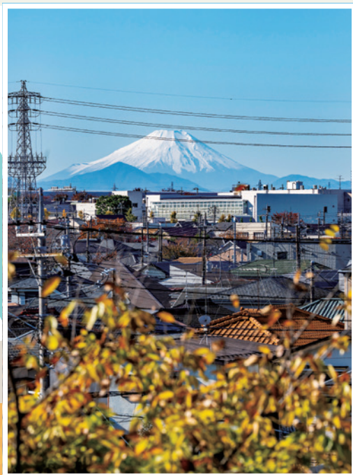
風の丘公園から見える富士山 (大泉町1-44-26)