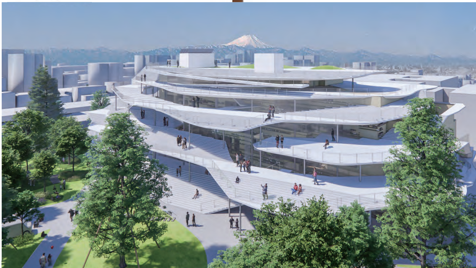
基本設計時の美術館・図書館リニューアルイメージ