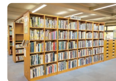
▲図録コーナーの様子

図書館と美術館が一体となって地域に貢献したいという思いで、美術館の企画展の開催に合わせて、図書展示コーナーに周知用のオリジナルポスターを掲示したり、ワークショップを一緒に行ったりしてきました。リニューアルに合わせてさらに連携を深め、多くの美術関係図書を美術館から移管し、現在でも3,000冊以上ある図録などをさらに充実させます。また、カフェやブック・アート・キッズスペースなどが設置される予定ですので、幅広い年代の方に利用していただきたいですね。