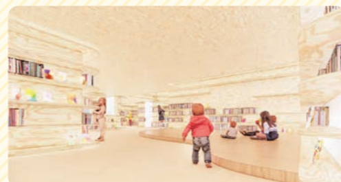
▲児童開架スペース

アートと本に囲まれた子ども向けの創作空間で、心躍る体験が味わえます。企画展と連動した図書展示、本を持ち込めるカフェなどもあります。