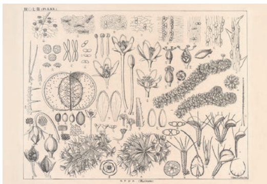
ムジナモの図 牧野富太郎 所蔵 高知県立牧野植物園