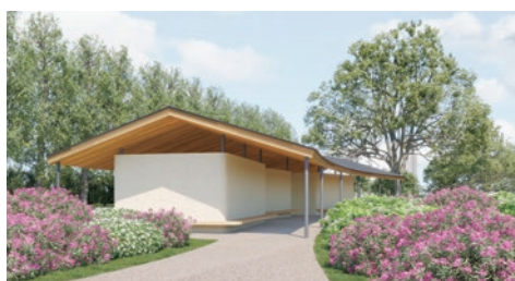
▲トイレリニューアル完成イメージ

練馬駅前に位置し、さまざまなつつじが咲き誇る、区の顔となる公園です。開園から30年がたち、全面リニューアルを進めています。