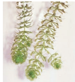
ムジナモ