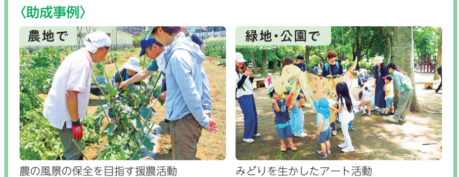
農の風景の保全を目指す援農活動 みどりを生かしたアート活動