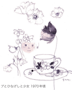
いわさきひろ ティーカップとひなげしと少女 1970年頃

広告 お売り下さい。使わなくなった物。 〒179-0076 東京都練馬区土支田 3-47-8 電話(FAX)03-3922-0422 / 携帯電話 090-5500-5923 古道具くら