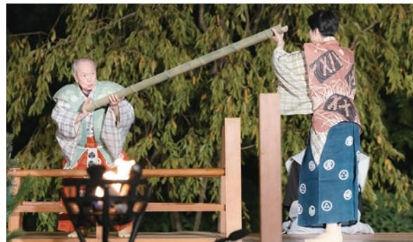
石神井松の風文化公園で毎年9月に開催