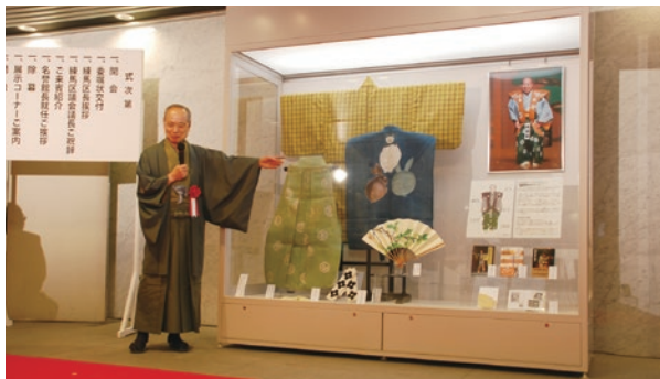
練馬文化センター1階で狂言装束や著書などを展示