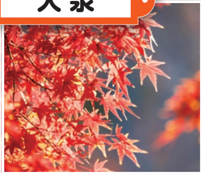
大泉町もみじやま公園 (大泉町3-23-1)