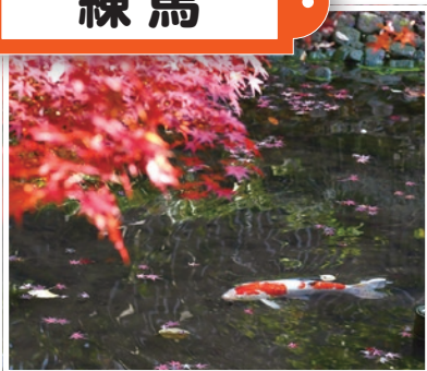
向山庭園のニシキゴイ (向山3-1-21)