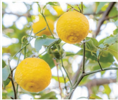
牧野記念庭園のユズ (東大泉6-34-4)