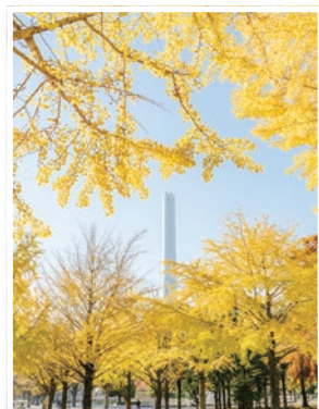
光が丘公園(光が丘2- 4丁目、旭町2丁目)