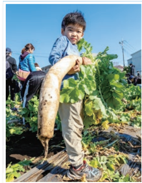
高松みらいのはたけでの 練馬大根引っこ抜き競技 大会(高松2-23-17)