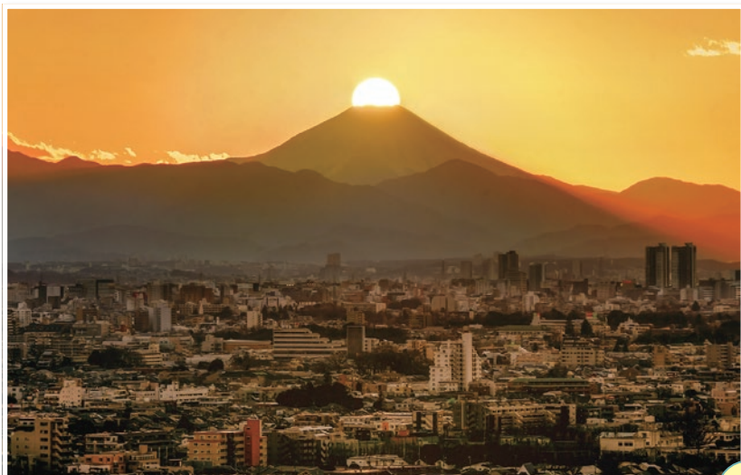
練馬区役所展望ロビーから見えるダイヤモンド富士(豊玉北6-12-1)