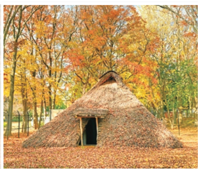
城北中央公園 (氷川台1丁目、羽沢3丁目)