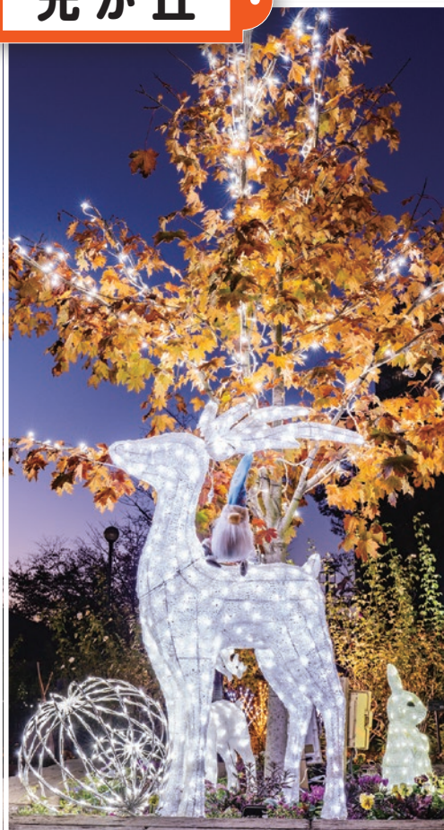
四季の香ローズガーデン (光が丘5-2-6)