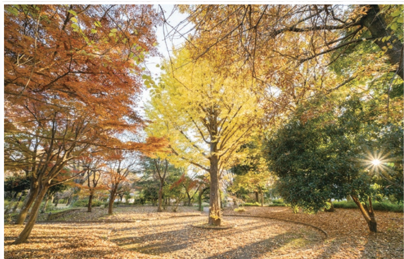
大泉中央公園(大泉学園町9丁目)