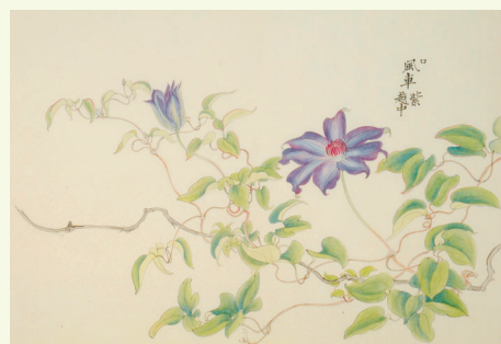
関根雲停筆 風車 個人蔵