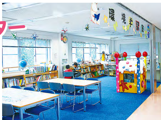
▲春日町リサイクルセンター

環境・リサイクル活動に役立つ図書の貸し出しや情報パネルの展示などを行っています。夏休み中は、リサイクル工作などの講座も開催しています(要予約)。