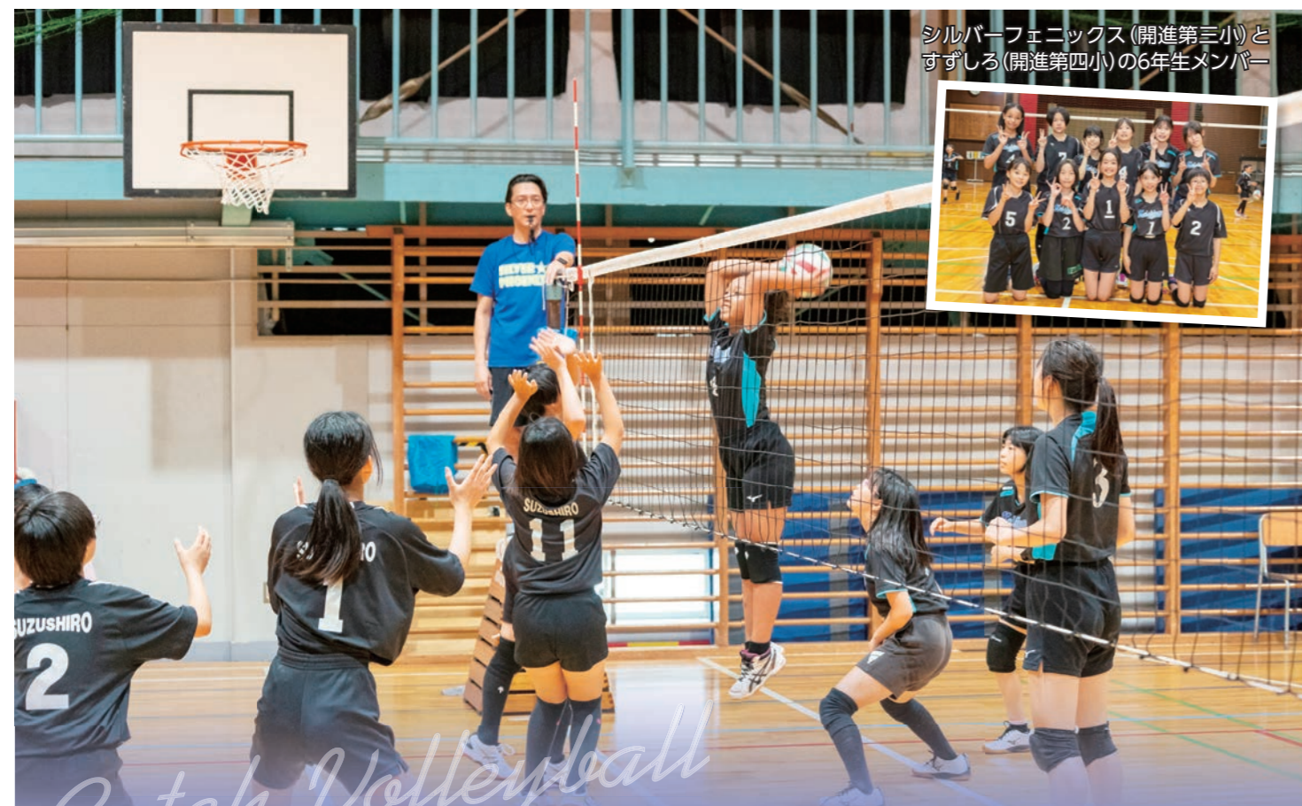
シルバーフェニックス(開進第三小)と すずしろ(開進第四小)の6年生メンバー