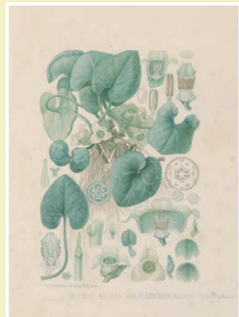
ウンモンカンアオイ 佐久間文吾・伊藤篤太郎筆