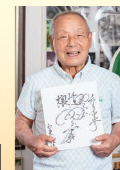
好きな言葉「根性」を書いていたきました