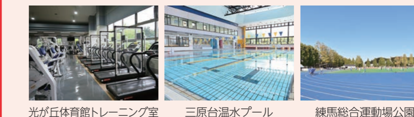
光が丘体育館トレーニング室