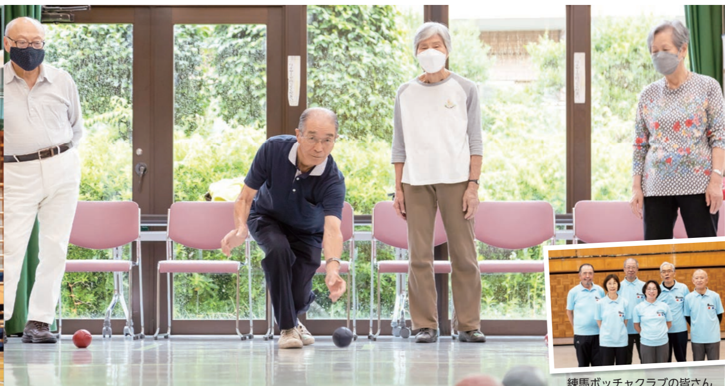
練馬ボッチャクラブの皆さん