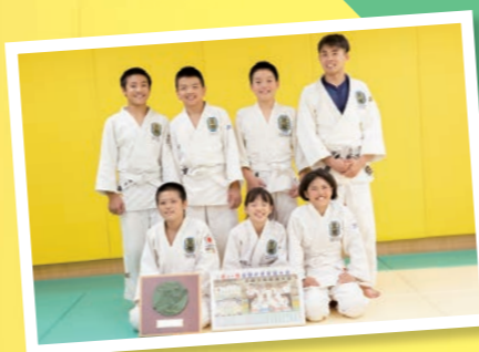
全国少年柔道大会団体戦 3位のメンバー

豆腐柔道クラブは平成27年2月に大泉学園に道場を開きました。それから9年、今年5月の全国少年柔道大会では団体戦3位になり、2人が技術優秀賞を頂くまでになりました。