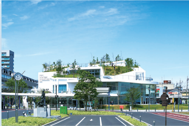
太田市美術館・図書館 平成29年 ©Daici Anno 設計:平田晃久

▶ 申込: 1 同ホームページまたは往復ハガキで①催し名②参加者全員(2名まで)の住所・氏名(ふりがな)・年齢(学生は学年も)・電話番号を、8月9日(必着)までに〒176-0021 貫井1-36-16 練馬区立美術館へ 2 当日会場へ ※1は観覧券の半券、2は当日の観覧券が必要です。 ※その他の催しについては、同ホームページをご覧ください。