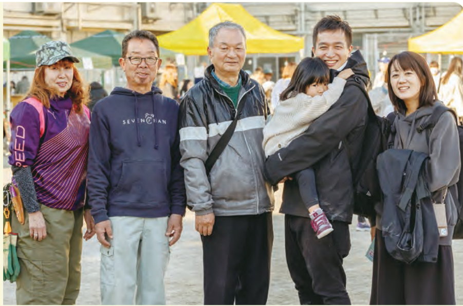
お祭りに参加していた町会の皆さん