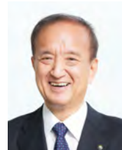
練馬区長 前川 耀男

生活をより豊かにする施策にさらに力を入れ、グランドデザイン構想で示す練馬区の目指すべき将来像を実現する。そのための「第3次みどりの風吹くまちビジョン」であり、これに基づく来年度予算です。着実に実行し、子どもから高齢者まで、誰もが安心して心豊かに暮らせるまちを創りたい、固く決意しています。練馬区のさらなる発展に向け、引き続き区民の皆さんと力をあわせ、全力を尽くしてまいります。