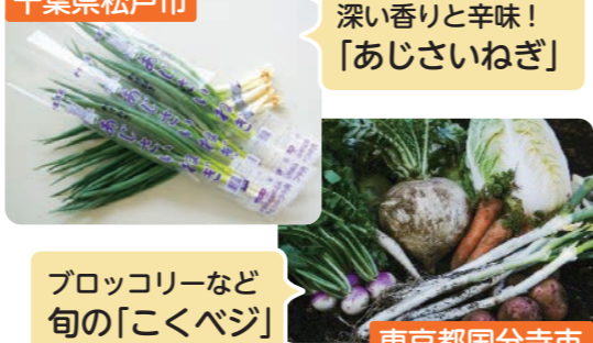
深い香りと辛味! 「あじさいねぎ」