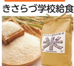
きさらず学校給食米