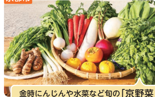
金時にんじんや水菜など旬の「京野菜」