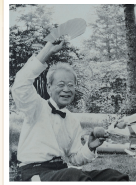
桃を手にする牧野富太郎 個人蔵

植物は子孫を残すために、タネを遠くへ飛ばす工夫をしています。本展では、牧野博士が採集したタネと実などを展示するとともに、タネの不思議な仕組みを紹介します。