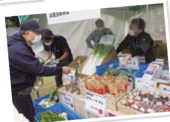
企画構成:伊藤裕太