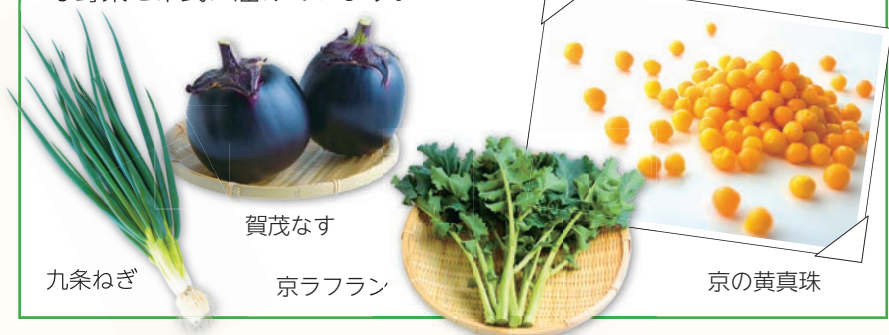
九条ねぎ 賀茂なす 京ラフラン 京の黄真珠

恵まれた地形と気候、都としての歴史がある京都市では、古くから多種多様な京野菜が生産されています。豊かな食文化を支えてきた、「賀茂なす」「九条ねぎ」などの伝統野菜や、新しく生まれた、「京の黄真珠」「京ラフラン」などの新京野菜の販売促進に力を入れています。また、農業者が自ら販売して回る「振り売り」などにより、新鮮な野菜を市民に届けています。