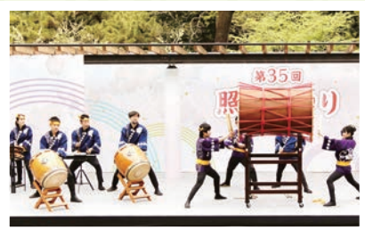
石神井太鼓保存会 せんば太鼓

行列迎え太鼓 午後1時35分から 照姫行列お披露目 午後1時45分から 行列送り太鼓 午後2時5分から