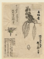
リンボク 明治14年 個人蔵

本展では、博士が描いた植物図や「日本禾本莎草植物図譜」の写真などを通して、植物とともに歩んだ博士の人生を紹介します。