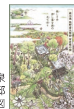
東大泉 牧野富太郎邸 百花庭の図

▶日時:4月24日(月)午前9時～午後5時 ▶問合せ:みどり推進課施設係 ☎5984-1664