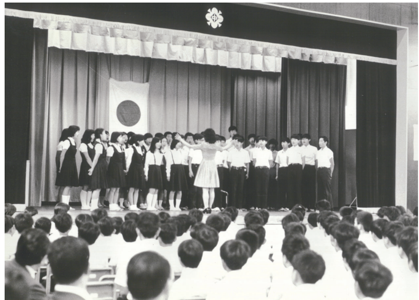
練馬東中 校歌制定式での合唱(昭和49年6月21日)